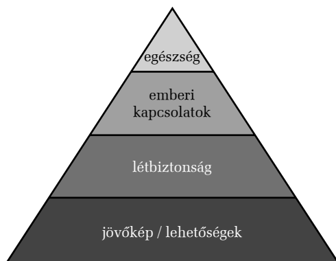
2. ábra. Az értékpreferenciák jellegzetességei

mindenhol a materiális tényezők elé sorolódtak. A materiális értékek általában a rangsor középső helyén foglalnak helyet, amely jelzi ugyan fontosságukat, de utal arra is, hogy az értékrendben nem elsősorban az anyagi tényezők képezik a vezérmotívumot. További sajátosság, hogy a távolabbi jövőre vonatkozó tényezők, mint az élettervek megvalósítása vagy a jövőbeli lehetőségek a rangsor végén helyezkednek el. Kivételt képez ez alól a tanulási lehetőségek, amely a célcsoport érintettsége okán magasabbra értékelt.